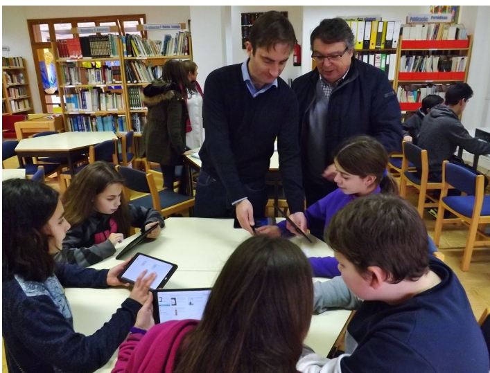
Agrupamento de Escolas de Vila Nova de Cerveira

O Sr. Diretor participou no momento oficial da apresentação deste novo serviço, que se espera que venha a ser uma mais-valia para a dinamização deste espaço, fundamental na formação dos jovens para o Século XXI.