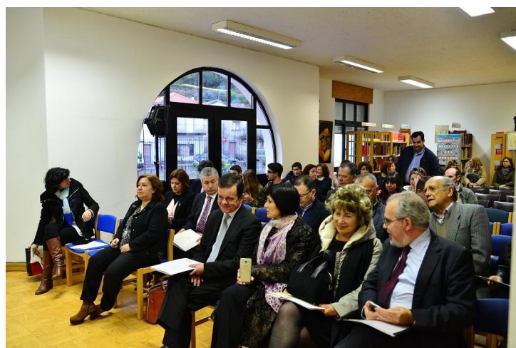
Agrupamento de Escolas de Vila Nova de Cerveira

Após a análise dos vários contributos, iremos apresentar ao público a nossa proposta final de alteração da lei das finanças locais, lançando uma petição pública a fim de ser discutida na Assembleia da República. Esperamos poder contar com o apoio dos nossos concidadãos, quer a nível distrital, quer a nível nacional, uma vez que é premente criarmos condições para um desenvolvimento mais equilibrado do território nacional, não beneficiando apenas os grandes centros urbanos.