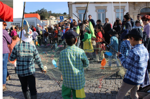
Município de Vila Nova de Cerveira