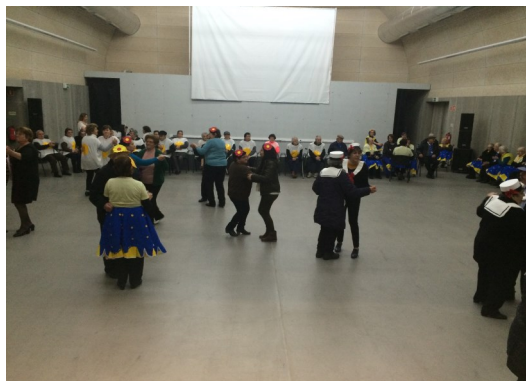
Grupo Dar Vida Aos Anos