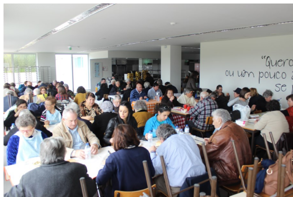
Grupo Dar Vida Aos Anos