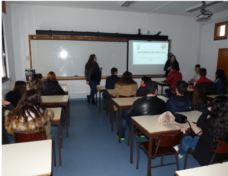
Agrupamento de Escolas de Vila Nova de Cerveira

Esta atividade foi dinamizada por técnicas do Instituto Português do Desporto e da Juventude, que abordaram esta temática de forma muito simples e aberta, promovendo uma acesa discussão e participação por parte dos nossos alunos. O verdadeiro amor apenas é alcançado quando existe respeito entre as partes!