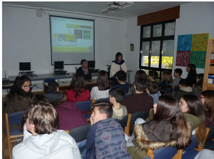
Agrupamento de Escolas de Vila Nova de Cerveira

Agradecemos à Sr. a Deputada a amabilidade e simpatia com que participou em mais uma atividade organizada pela nossa escola.