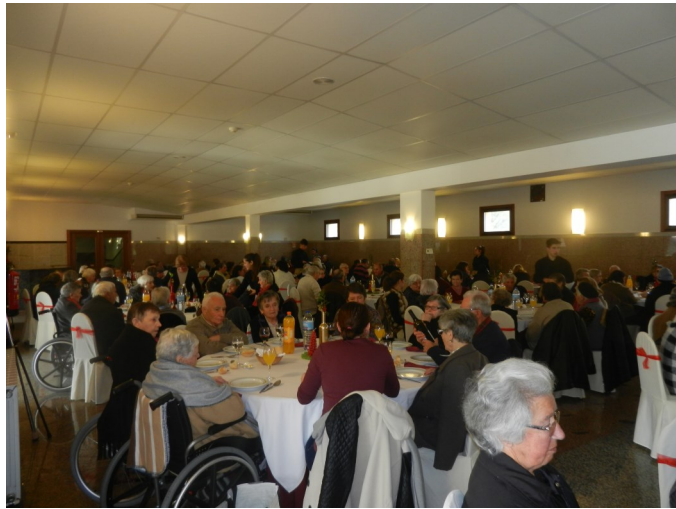
Grupo Dar Vida Aos Anos

No final, cada idoso recebeu uma pequena lembrança oferecida pela autarquia cerveirense.