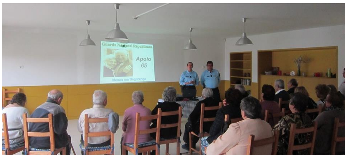
Associação de Desenvolvimento Social e Local de Vila Nova de Cerveira

Neste sentido, e de forma a alertar os utentes, a ADSL promoveu no Espaço Sénior de Gondarém, com o apoio da Escola Segura, uma ação de Sensibilização subordinada ao tema “Os riscos de burlas”, de forma a informá-los sobre quais os procedimentos de segurança que devem adotar em caso de burla.