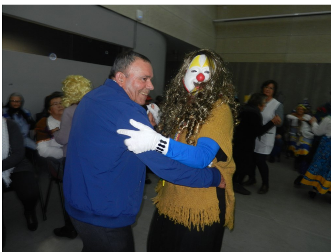
Grupo Dar Vida Aos Anos