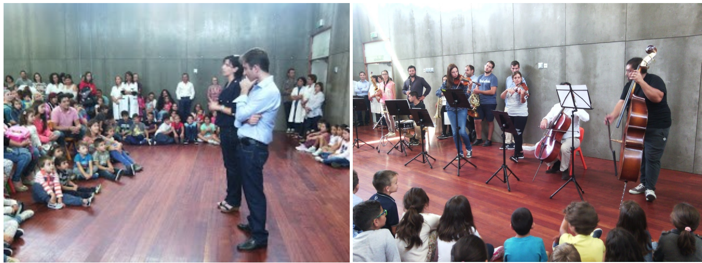
Agrupamento de Escolas de Vila Nova de Cerveira