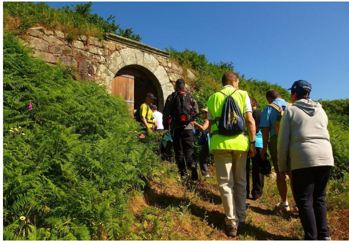
Município de Vila Nova de Cerveira

Porque os meses de verão estão muito associados a atividades ao ar livre e apostada numa política de educação para a saúde, a autarquia cerveirense sugeriu, para os fins-de-semana, uma programação lúdico-desportiva integrada na iniciativa 'Cerveira Saudável', desde caminhadas, passeios de bicicleta, demonstração de remo, entre outras.