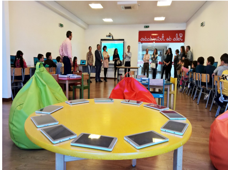
Agrupamento de Escolas de Vila Nova de Cerveira

Este espaço contribuirá para uma melhor preparação dos nossos alunos para um futuro que, já ninguém duvida que vai depender, cada vez mais, da tecnologia.