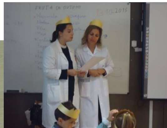
UCC Saúde em Movimento