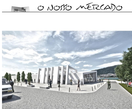
MERCADO MUNICIPAL DE CAMINHA