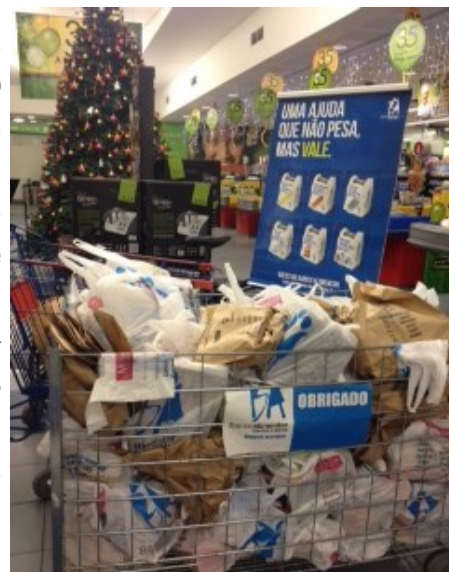
Município de Vila Nova de Cerveira

Um verdadeiro espírito de entreajuda e solidariedade marcou a campanha de recolha de bens alimentares em Vila Nova de Cerveira, durante o último fim-de-semana de novembro. O Banco Local de Voluntariado angariou um total de 3.470 quilogramas nas duas superfícies comerciais. Obrigado! Felizmente Vila Nova de Cerveira conta com inúmeros rostos de solidariedade, com uma dedicação incansável ao outro. A Câmara Municipal agradece todo o apoio, empenho e disponibilidade dos 66 voluntários inscritos e da participação, pela primeira vez, de oito meninas que integram a 1ª Companhia de Cerveira – Associação Guias de Portugal acompanhadas por duas responsáveis. O executivo cerveirense dirige ainda uma palavra de agradecimento a toda a população que doou produtos, revelando uma grande sensibilidade em prol dos mais carenciados.