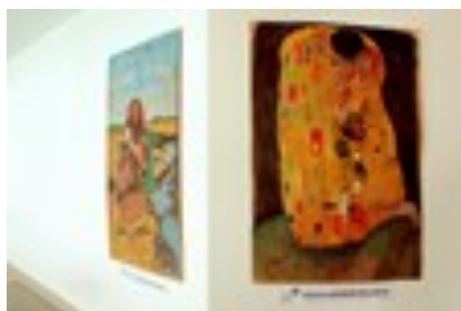
Escola Superior Gallaecia