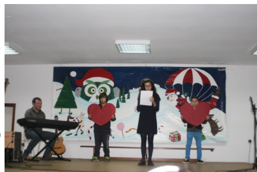
Colégio de Campos

É no Natal que os sentimentos se transformam e que os corações se deixam contagiar pelos sentimentos nobres.