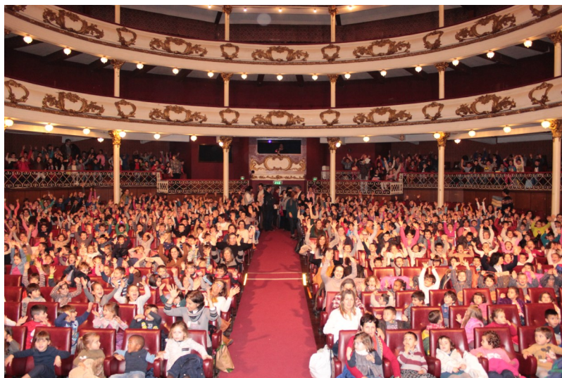
Município de Vila Nova de Cerveira